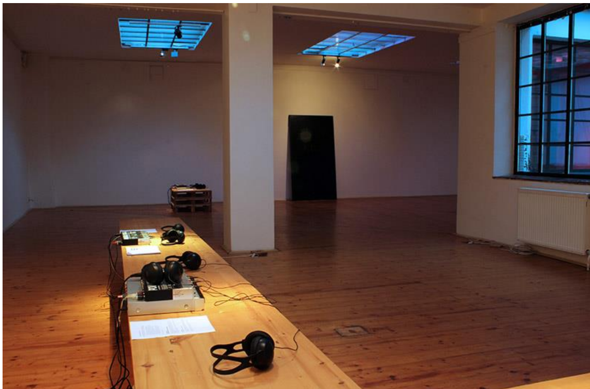
Tichá pole cestou z práce 14.1.-29.1.2014

Tichá pole cestou z práce poslechová instalace 14.1. – 29.1.