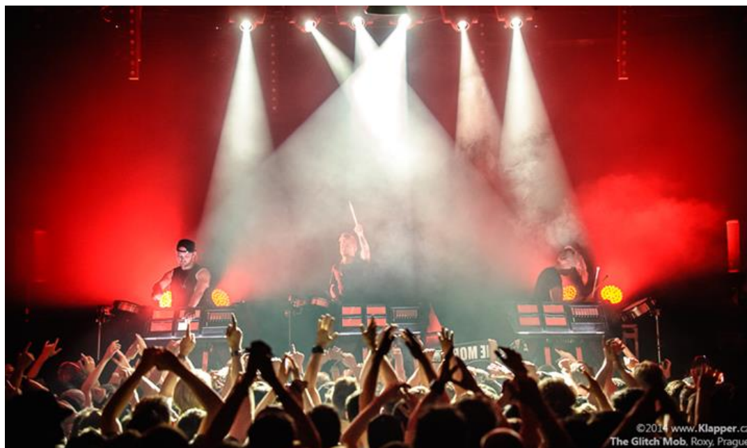
Glitch Mob – Roxy 26.5.2014

Experimentální prostor Roxy/NoD je jeden z nevyraznějších uměleckých domů. Klub Roxy i prostor NoD se vzájemně kreativně doplňují, ovlivňují a vytvářejí společně kvalitní nabídku současného umění napříč žánry. Výraznou událostí celého roku 2014, která je oslavou celého prostoru a jeho uměleckých produkcí, bude již druhý ročník festivalu Roxy/NoD Be twenty two . Experimentální prostor Roxy/NoD úzce spolupracuje se svým zakladatelem - Linhartovou nadací , a to zejména v oblasti výtvarné dramaturgie.