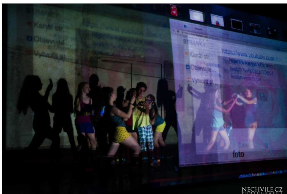
Generace FB 3.6.2014

Po 30. 6. od 18:00 Apostrof | Theatre Pearl (IRI) / Nasrollah Ghaderi: MY SOUFIYA