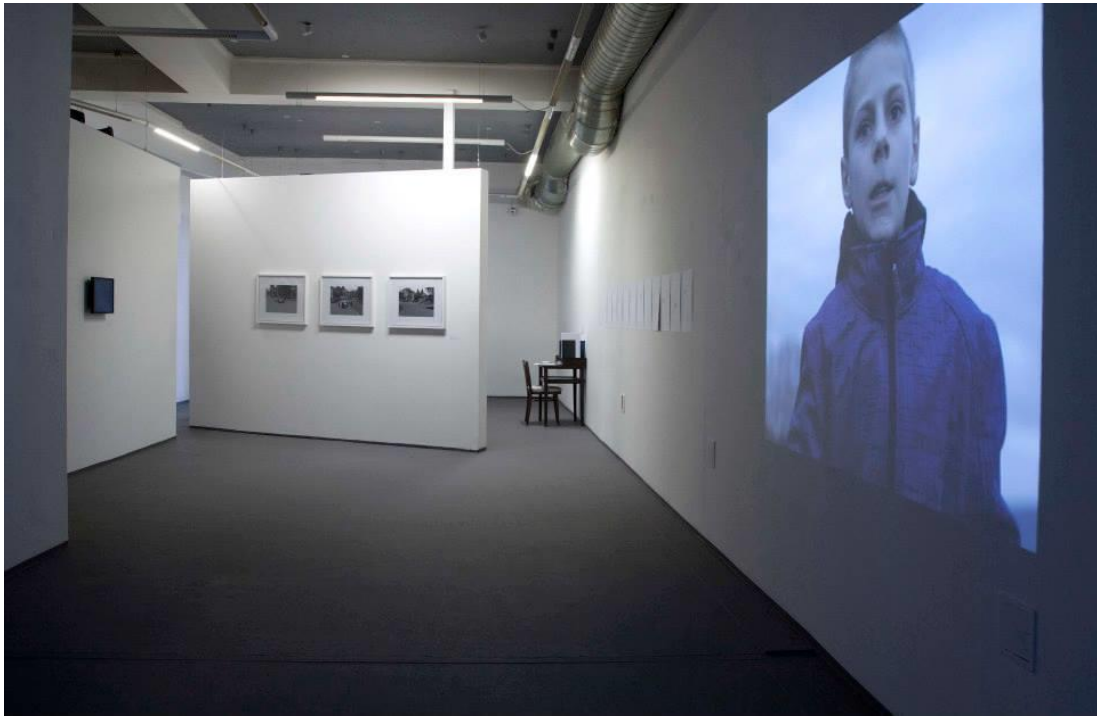
Prostory narace 11.6.-4.7.2014