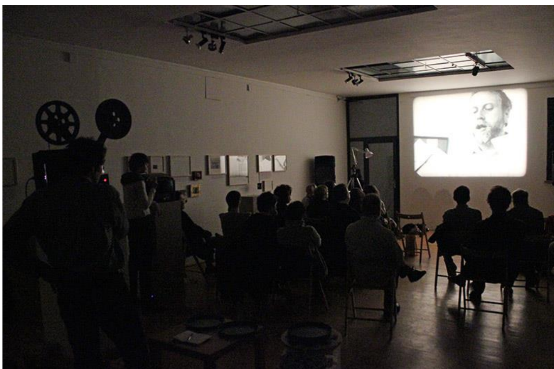
Behind the Voice – 21.2.2014