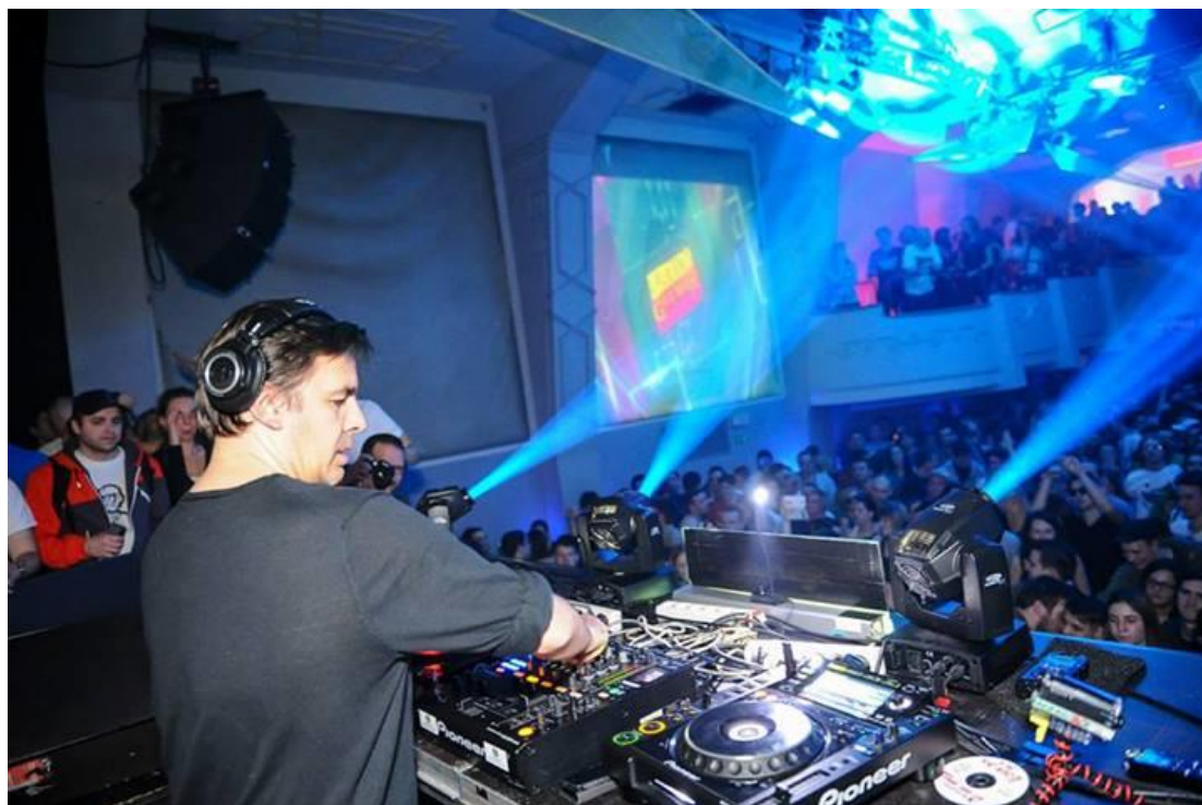
Laurent Garnier – Roxy 24.1.2014

LAURENT GARNIER (FR) – francouzský, velmi uznávaný legendární multiinstrumentalista, dj a producent