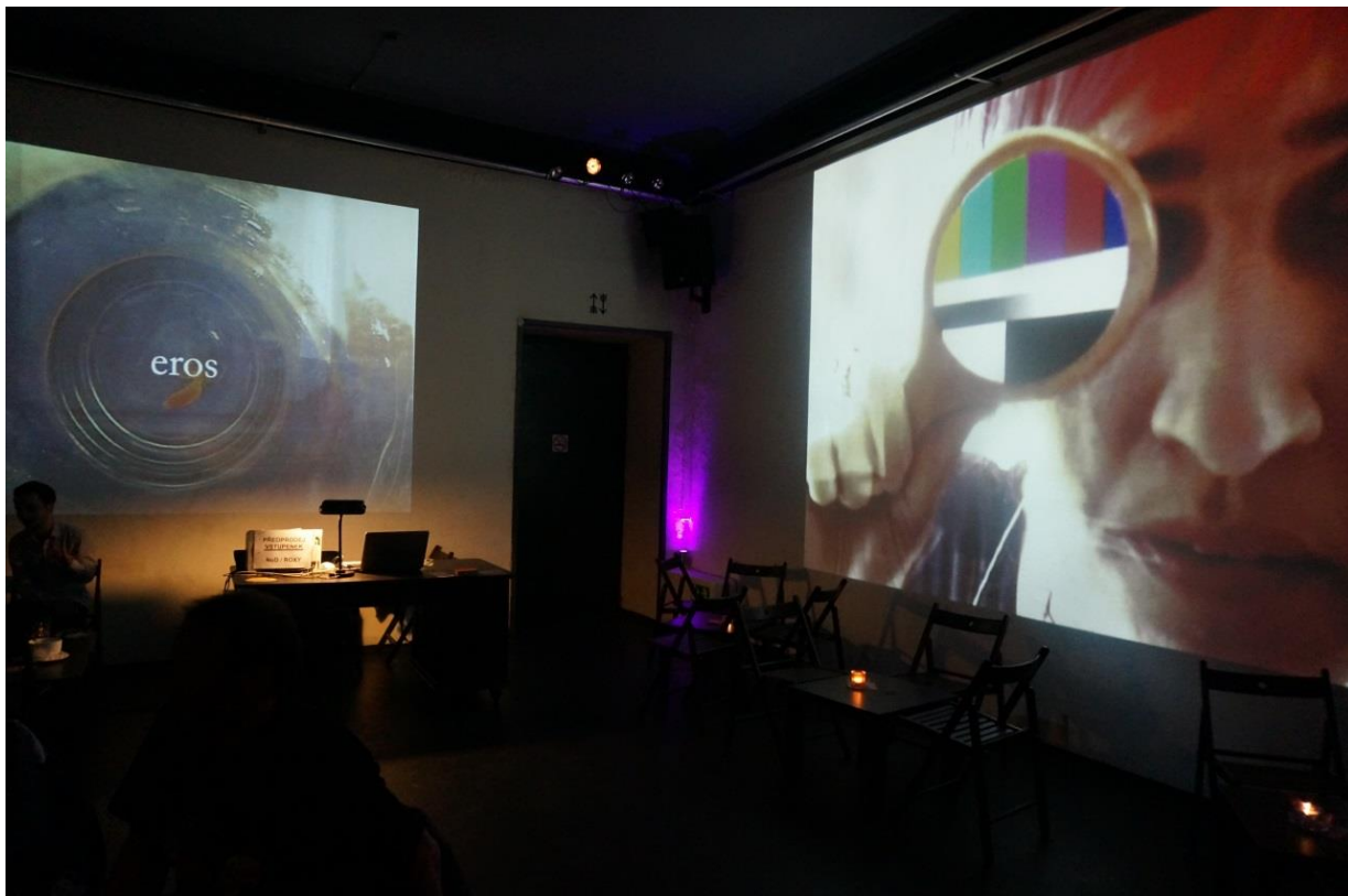
Femlink – Resistance 19.3.-31.3.2014