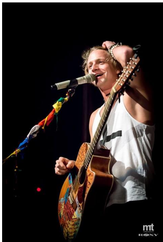
Tomáš Klus – Roxy 22.4.2014